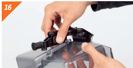
Montare il rubinetto.