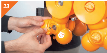
Fissare le manopole e serrare bene. Le manopole mancanti devono essere sostituiti immediatamente. Non utilizzare mai la macchina qualora manchi una manopola di fissaggio.