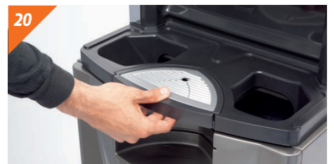
Posizionare il vassoio di portabicchieri e il filtro.