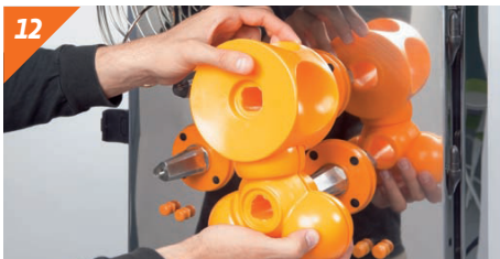
Montare le unità di spremitura per coppie.

Per riassemblare la macchina ripetere con attenzione esattamente il processo inverso e la macchina è pronta per lavorare.