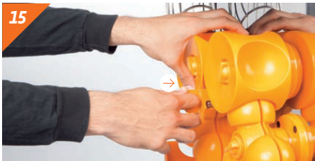
Posizionare il coltello. Spingere fino a quando non scatta in posizione con un "clic".