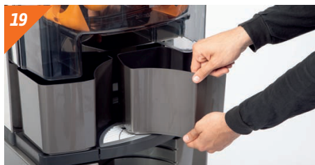
Montamos las cubetas de cortezas.