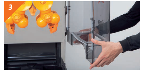
3 Desmontamos la cubierta delantera.