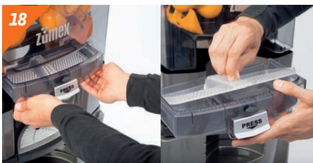
Colocamos de nuevo el filtro y la cubeta.