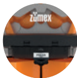
Nuovo involucro dal design integrato