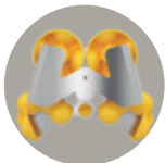
1Step 5 Kit