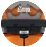
Neue integrierte Designabdeckung