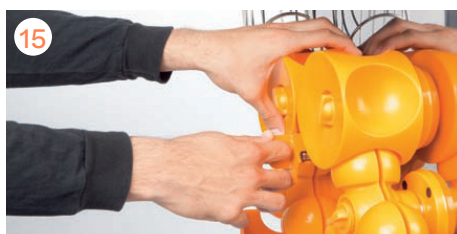
Posizionare il coltello. Spingere fino a quando non scatta in posizione con un "clic".