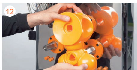
Montare le unità di spremitura per coppie.

Per riassemblare la macchina ripetere con attenzione esattamente il processo inverso e la macchina è pronta per lavorare.