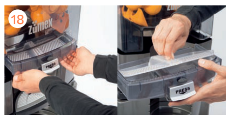
Colocamos de nuevo el filtro y la cubeta.