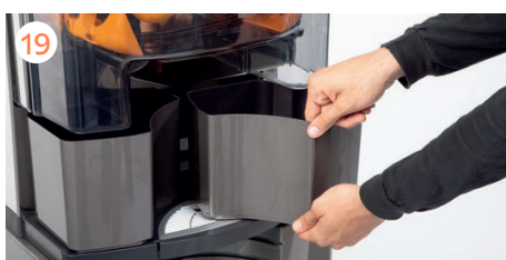
Montamos las cubetas de cortezas.