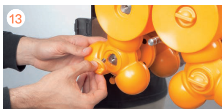
Enroscamos los volantes firmemente. Si hemos perdido algún volante, lo sustituimos, nunca exprimiremos si falta alguno.