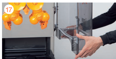
Montamos la cubierta.