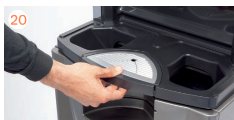
Colocamos la bandeja anti goteo y su filtro.